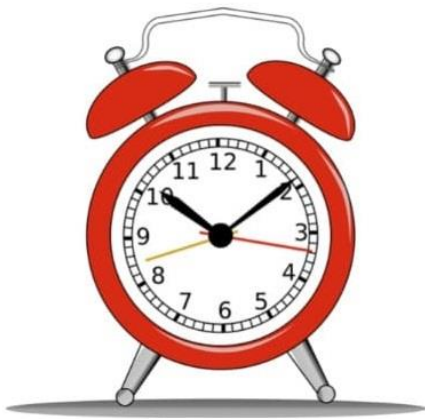
budík - Wecker